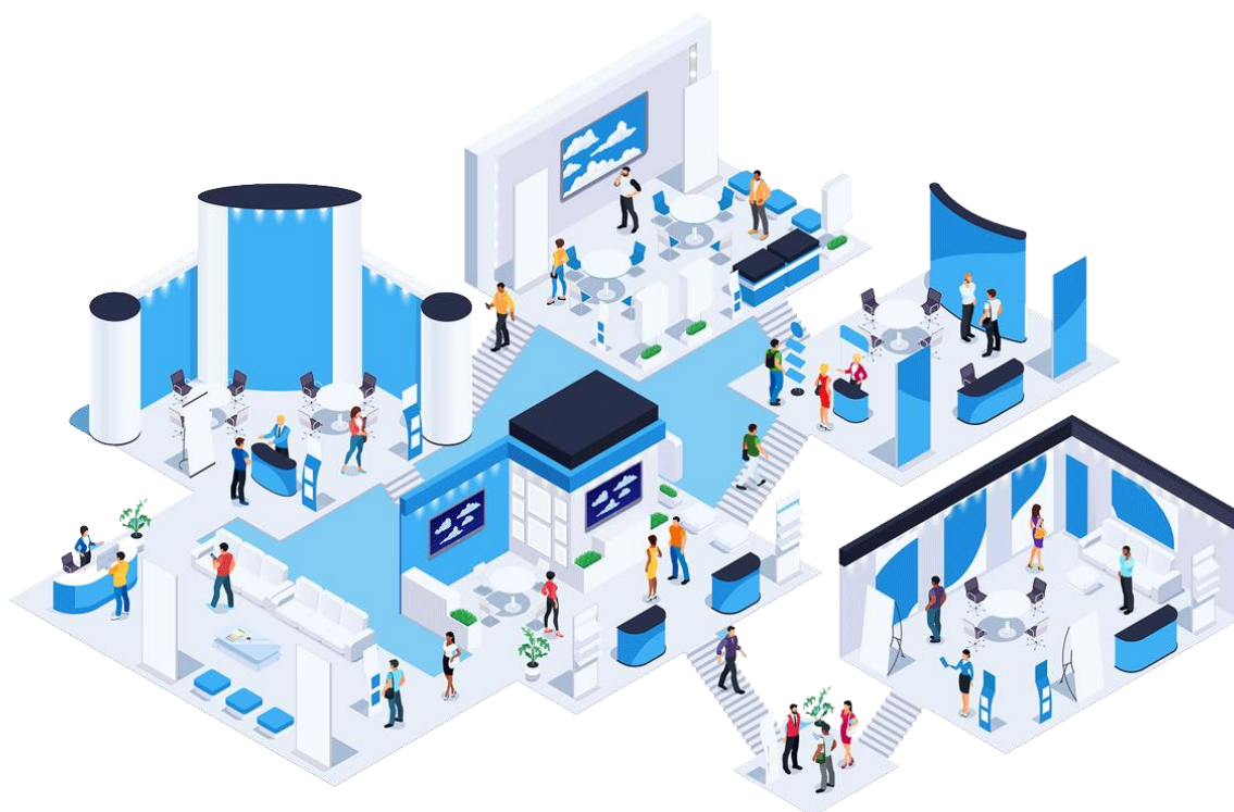
Slika 6: Informativni dnevi 2021

Ker pa smo si tutorji želeli, da bodoči študenti vsaj malce spoznali notranjost naše fakultete, smo za vas v petek pripravili t.i. virtualni live potep po Zdravstveni fakulteti, na katerem sta se po naši fakulteti sprehajala dva naša študenta in vam predstavila fakulteto. Na potepu so spoznali nekaj naših študentov tutorjev, morda srečali kakšnega predavatelja, stopili v našo največjo predavalnico, se sprehodili skozi knjižnico in spoznali še ostale kabinete in laboratorije, kjer poteka naš študijski proces.