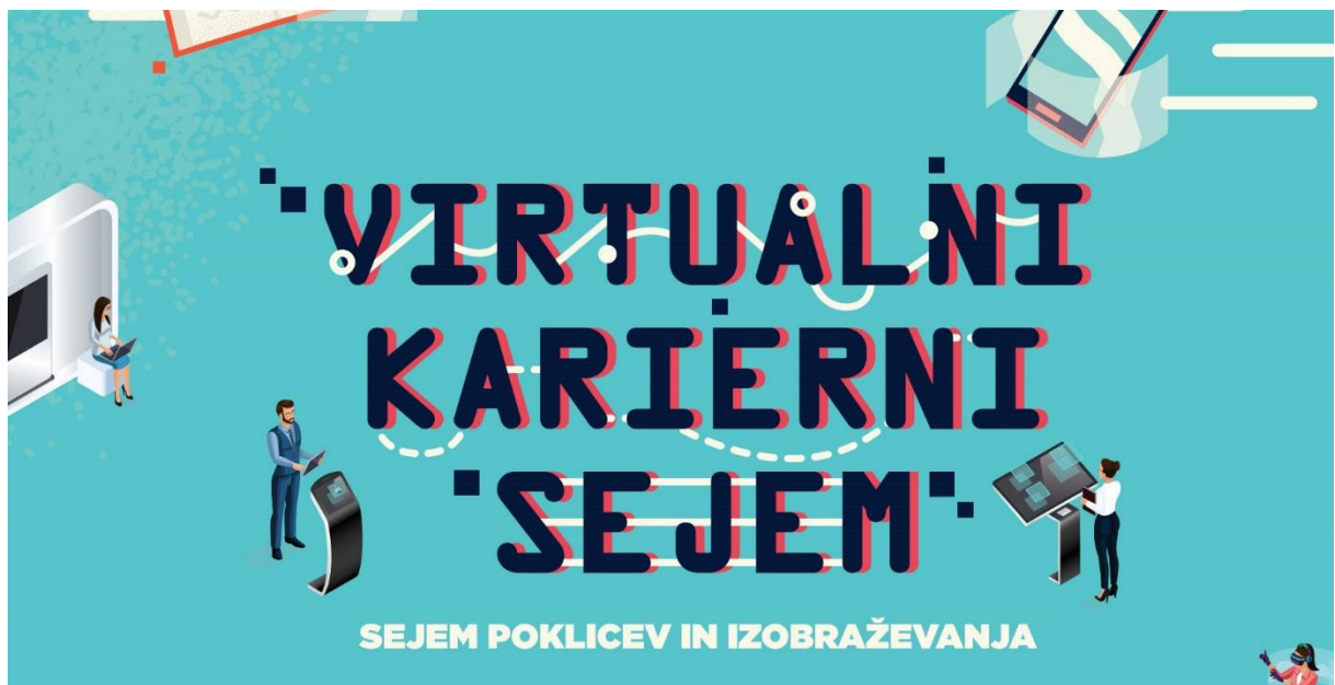
Slika 3: Virtualni karierni sejem

Zdravstvena fakulteta je dogajanje na svoji stojnici obogatila s številnimi webinarji in klepetalnicami. Člani posameznih oddelkov so predstavili posamezne študijske programe, na vprašanja mimoidočih so odgovarjali študenti tutorji in Služba za študijske zadeve.