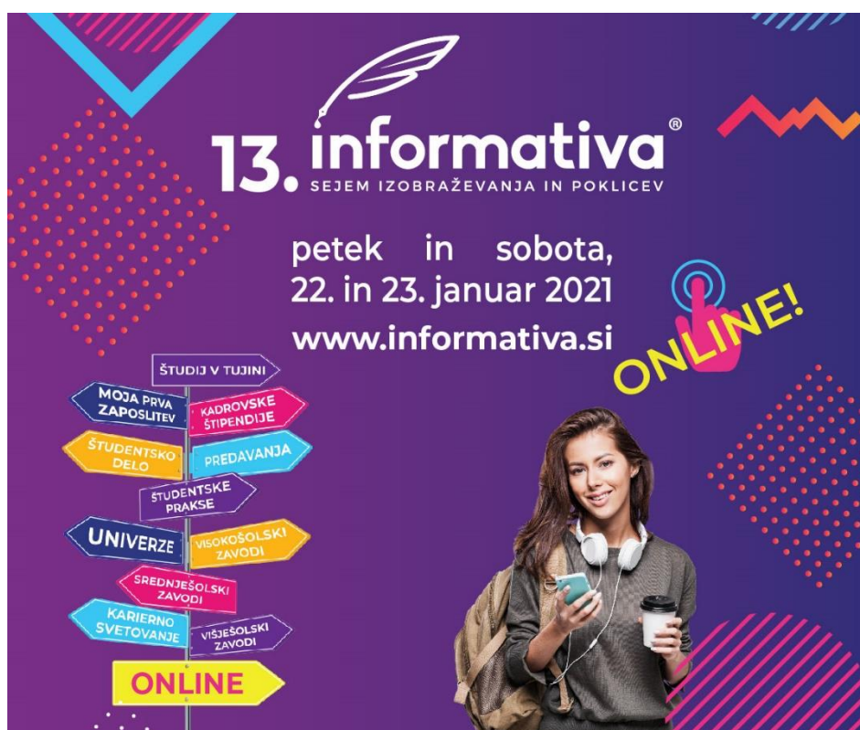
Slika 5: 13. informativa

Zdravstvena fakulteta je dogajanje na svoji stojnici obogatila s številnimi webinarji. Člani posameznih oddelkov so predstavili posamezne študijske programe in skupaj s študenti tutorji odgovarjali na vprašanja bodočih študentov. Služba za študijske zadeve je odgovarjala na vprašanja v zvezi z vpisom in študijem na splošno. Oba dneva med 9. in 18. uro so bili obiskovalcem v klepetalnici ves čas na voljo študenti tutorji, ki smo odgovarjali na vprašanja udeležencev.