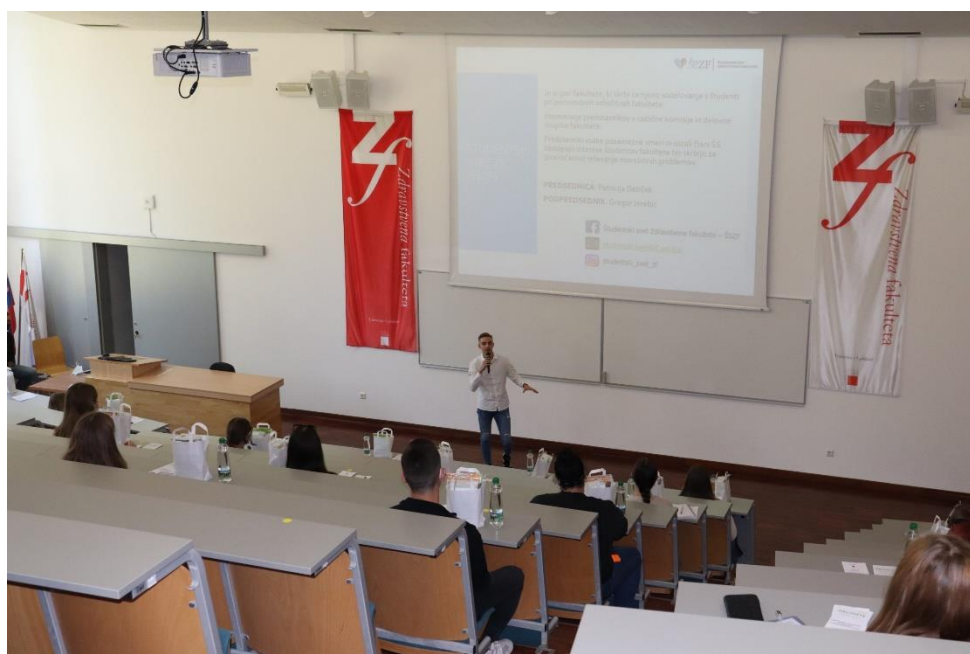
Slika 2: Sprejem brucev

Na dan sprejema smo se zbrali že zgodaj zjutraj, se pripravili in pričakali nove študente. Ker se zavedamo straha, ki ga prinašajo s sabo, smo jim želeli polepšati njihov vstop v odraslost. Najprej smo jih usmerili v veliko predavalnico kjer smo jim predstavili delovanje Študentskega sveta Zdravstvene fakultete, Študentske organizacije Zdravstvene fakultete – bolj znana pod imenom Pacienti in seveda delovanje tutorstva, po tem pa smo jih pospremili v predavalnice po smereh kjer so imeli mentorske sestanke. Pokazali smo jim, kako se uporabljata VIS-sistem in spletna učilnica, ki sta nepogrešljivi spletni strani za uspešn študij. Pripravili smo tudi nekaj koristnih nasvetov za nadaljnji študij. Po koncu uvodnih predstavitev smo bili na voljo za njihova vprašanja in dileme, ki so se pojavile med predstavitvijo. Predvsem so se vprašanja nanašala na pridobitev literature, organiziranost predavanj in vaj ter obštudijske dejavnosti, ki so jim na voljo. Povabili smo jih tudi na nekaj dogodkov, ki so sledili v prihajajočih mesecih, jim predstavili javni potniški promet v Ljubljani, podali nekaj nasvetov za dobro študentsko prehrano in sproščanje po študijskih obveznostih.