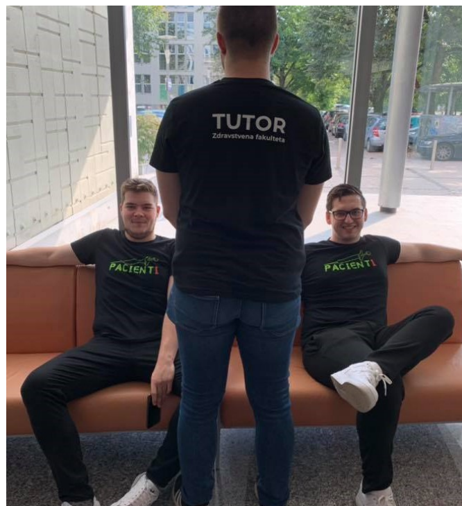
Slika 7: Lepo je biti tutor

Menim, da smo vse dobro speljali in zadnji mesec po pravilih izvedli še preostale vaje in izpite, ki jih nismo mogli opraviti preko spleta. Vsekakor mislim, da je ta situacija prinesla vsaj nekaj dobrega, da bomo v prihodnje še toliko bolj cenili in izkoristili možnost druženja med sabo, seveda ko bo vse to le mogoče.