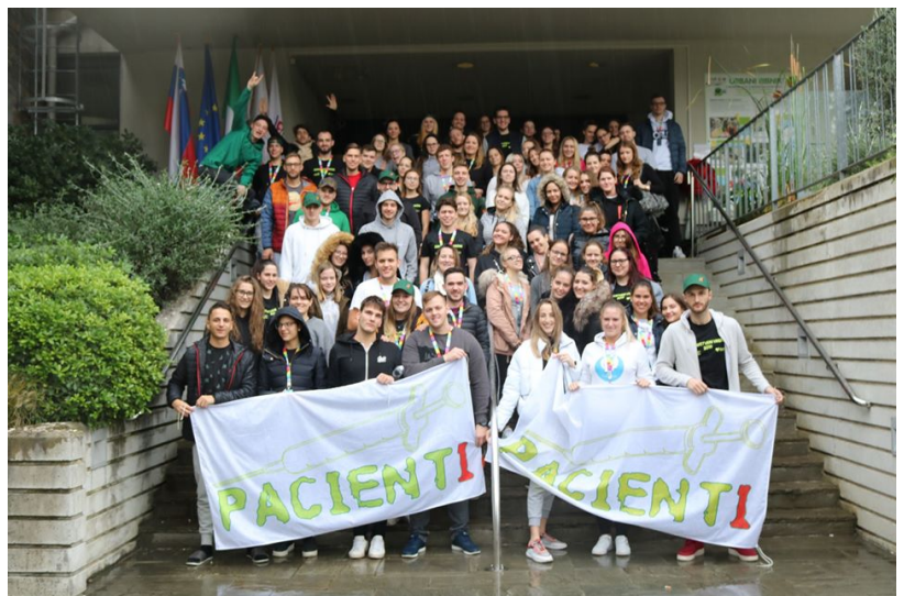
Slika 4: Zdravstvenega vikenda

Tutorji dogodke, podobne takšnim podpiramo, saj smo mnenja, da marsikdo nima poguma, da pristopi k nam med študijskim letom. Med manj uradnimi dogodki se lahko študenti (predvsem 1. letnikov) z nami bolj povežejo, izrazijo svoje dvome, postavijo vprašanja, se pogovorijo o težavah, ki se dogajajo in skupaj oblikujemo rešitve.