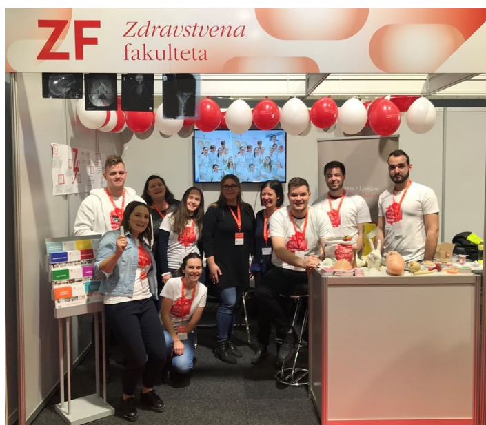
Slika 5: Stojnica na Informativi 2020

Na stojnici smo bili tutorji iz različnih študijskih smeri, tako da je vsako študijsko smer zastopal vsaj en tutor. Bodočim študentom smo odgovarjali na njihova vprašanja in jim predstavili naše študijske programe. Zanimali so jih pogoji za vpis, morebitni sprejemni izpiti za sprejem na fakulteto. Z veliko večino smo se pogovarjali o študentskem življenju in izzivih le tega, o urnikih, predvsem jih je zanimala praksa – koliko je prakse, kje se opravlja in ali je res, da po praksi popoldne sledijo še predavanja. Govorili smo o literaturi, ki jo uporabljamo za izpite in o težavnosti le teh. Nekateri so naše študijske smeri že precej dobro poznali in so se prišli le prepričati, da je to pravilna odločitev, drugi pa so za naše smeri slišali prvič in so jih zanimale bolj splošne informacije o Zdravstveni fakulteti, o programih, ki jih ponujamo in na splošno o študiju na naši fakulteti. Predstavili smo jim tudi možnosti za izmenjave v tujini in prav tako tudi občudijske dejavnosti naše fakultete, kot so Študentska organizacija Zdravstvene fakultete – Pacienti in Študentski svet Zdravstvene fakultete.