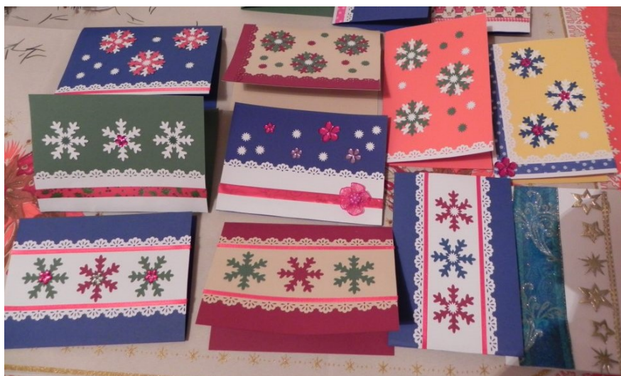
Slika 8: Voščilnice

December je mesec obdarovanj in dobrih del, zato smo se tutorji odločili, da za vse delavce fakultete izdelamo novoletne voščilnice in jim s tem polepšamo božično-novoletne praznike. Zbrali smo se 17.12. ter v dobrem, sproščenem vzdušju ob zvokih božičnih melodij izdelali voščilnice.