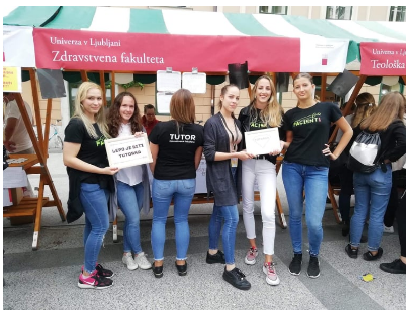
Slika 3: Pozdravu brucev na Kongresnem trgu

Pripravila Valentina Sylva (smer Udravstvena nega)