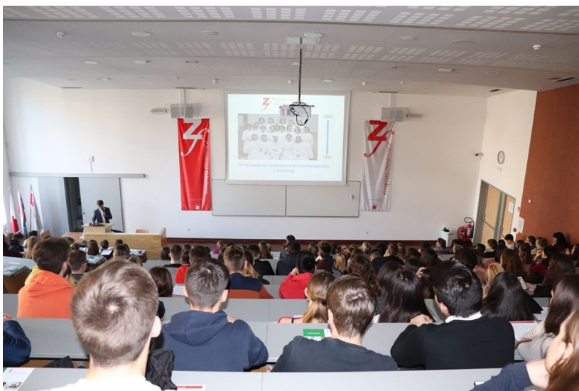
Slika 6: informativni dnevi na Zdravstveni fakulteti

Študente smo ob prihodu usmerjali do predavalnic, kjer so potekale predstavitve po posameznih programih. Predstavljeni so bili pogoji za vpis, predmetnik, pogoji za napredovanje v višji letnik, potek študija, možnost mednarodnih izmenjav in nadaljevanje študija na 2. in 3. stopnji. Študenti smo predstavili delovanje Študentskega sveta Zdravstvene fakultete, katerega člani so predstavniki posameznih študijskih smeri, Študentske organizacije Zdravstvene fakultete – bolj poznane pod imenom Pacienti in delovanje tutorstva. Podali smo jim nekaj razlogov, zakaj je vpis na Zdravstveno fakulteto dobra odločitev, predstavili naš vidik študija, izpostavili stvari, ki so nam všeč (predvsem veliko možnosti praktičnega usposabljanja na različnih lokacijah, delo z ljudmi, možnost dodatnega izobraževanja in mednarodnih izmenjav) ter predstavili, kje v okolici lahko študenti preživljajo prosti čas, kako ga preživljamo mi, kako dostopamo do literature in gradiva za študij. Po koncu uradne predstavitve, ki so jo vodili mentorji prvih letnikov in predstojniki posameznih študijskih smeri, smo tutorji dijake popeljali na ogled kabinetov za vaje, ki so opremljeni podobno, kot so opremljene bolnišnice in ostale zdravstvene ustanove. Profesorji so tam prikazali nekaj intervencij in bili odprti za vprašanja bodočih študentov, ki jih ni bilo malo. Po koncu smo študente pozvali, da izrazijo svoje dvome in jih skupaj razjasnimo.