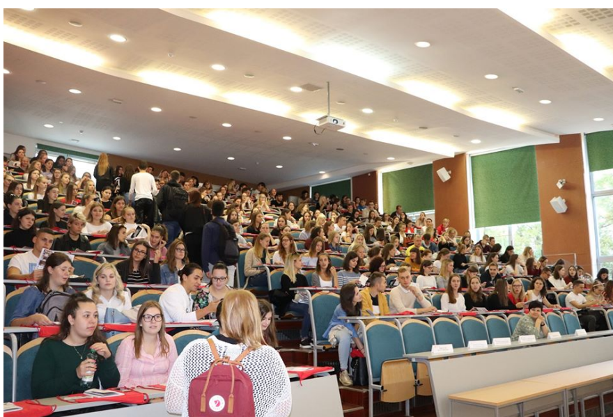
Slika 2: Sprejem brucev

Pripravila: Valentina Sylva (smer zdravstvena nega)