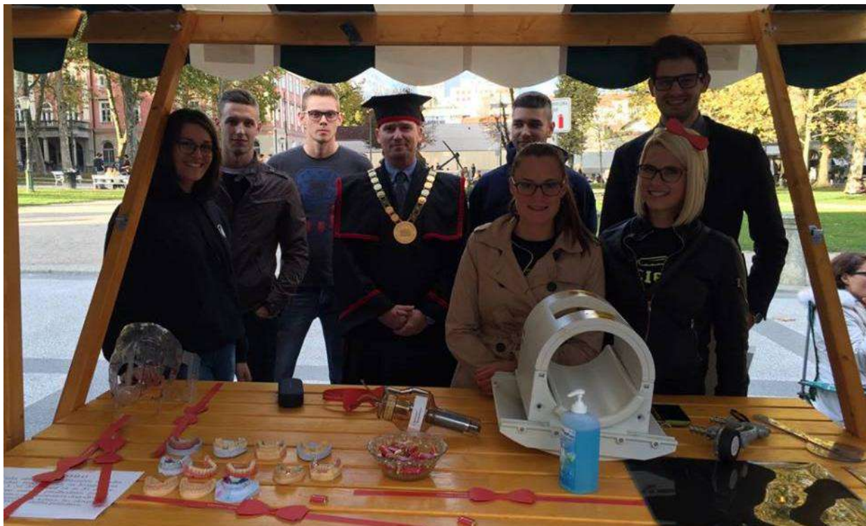
Slika 4: Študentje in dekan ZF na stojnici na Kongresnem trgu

Po opravljenem sprejemu brucev na Zdravstveni fakulteti je na Kongresnem trgu v Ljubljani potekal tradicionalen pozdrav brucev, ki ga vsako leto organizira Univerza v Ljubljani. Na Kongresnem trgu imajo tako članice vsaka svojo stojnico, kjer predstavijo svoje aktivnosti, na voljo so brošure o študijskih programih in drugi pripomočki. Obiskovalcem so predstavljene aktivnosti posamezne fakultete in pogoji za vpis. Na stojnici Zdravstvene fakultete smo tako delili letake o študiju, na voljo so bile tudi promocijske čokoladice Zdravstvene fakultete in Študentskega sveta. Predstavili smo vse študijske programe, pri vsakem smo imeli tudi nekaj delovnih pripomočkov. Študentje so na stojnici vztrajali do 18. ure, ko se je dogodek zaključil. Študentje so nato odšli na tradicionalen concert v ljubljanski Kampus.