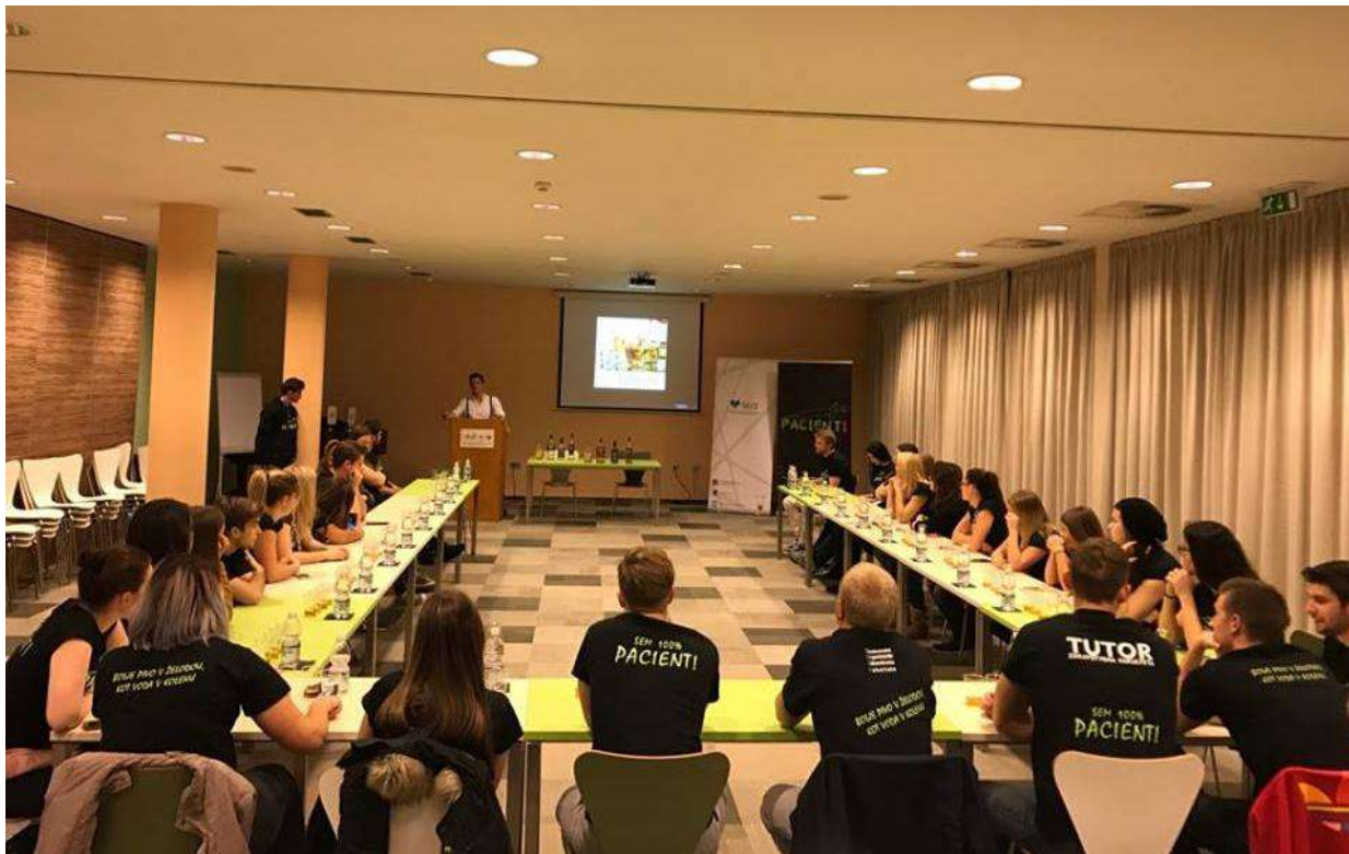
Slika 8: Študentje tutorji med izobraževalno delavnico; Motivacijski vikend 2016