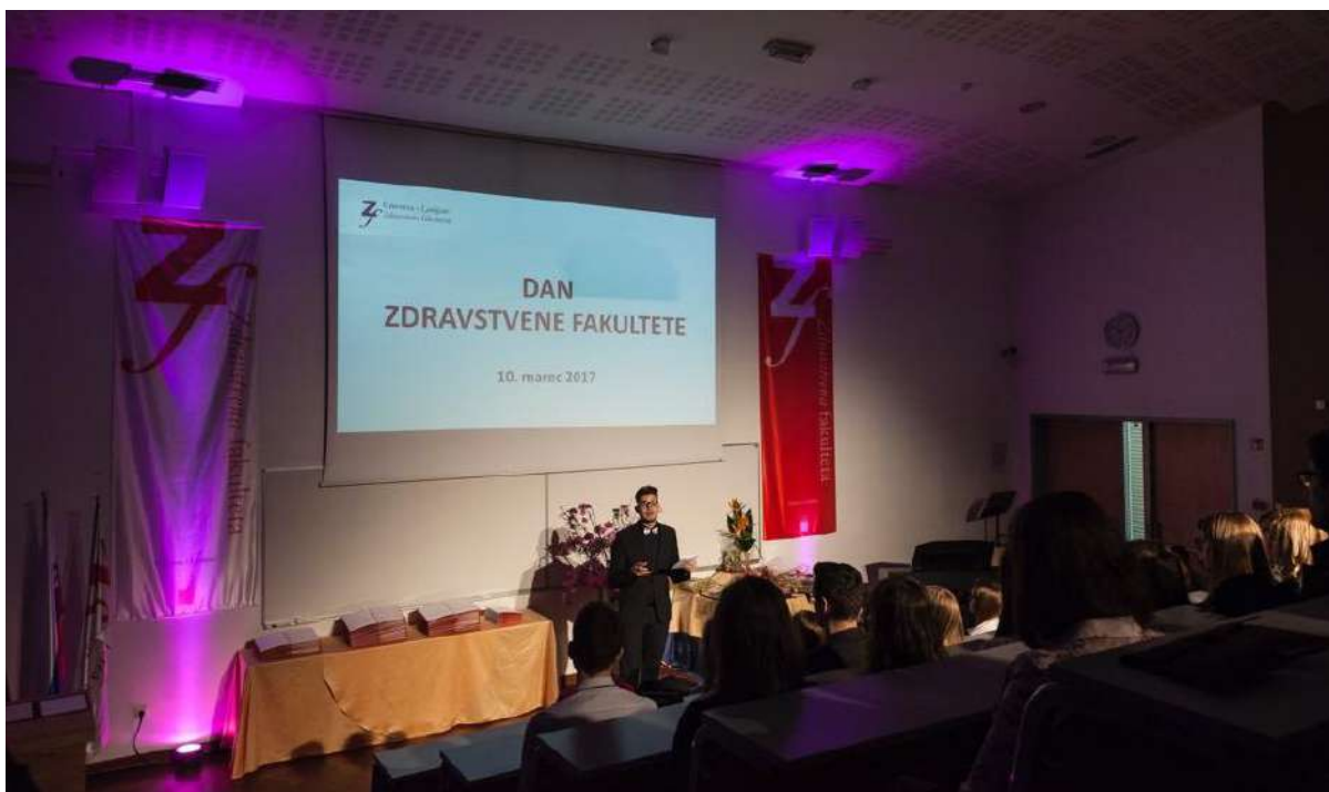
Slika 14: Dan Zdravstvene fakultete; 10. 3. 2017

10. 3. 2017 je na fakulteti potekal dan Zdravstvene fakultete, ki je napomembnejši in največji dogodek leta, saj tam praznujemo največje dosežke in podelimo priznanja tistim, ki si to zaslužijo. Sodelovali smo tudi študentje tutorji, tako pri usmerjanju, kot pri garderobi za goste.