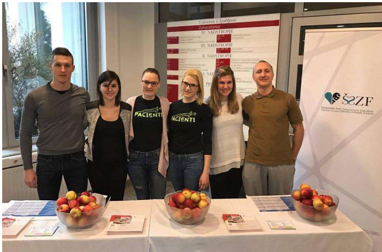
Slika 10: Tutorji študentje na stojnici ŠSZF ob informativnem dnevu; 11. 2. 2017