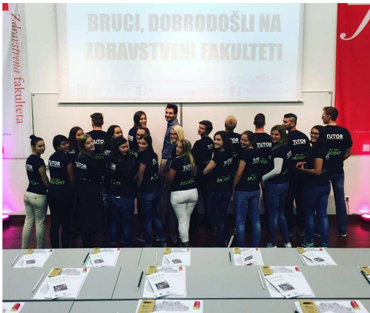
Slika 3: Študentje tutorji ob sprejemu brucev na ZF