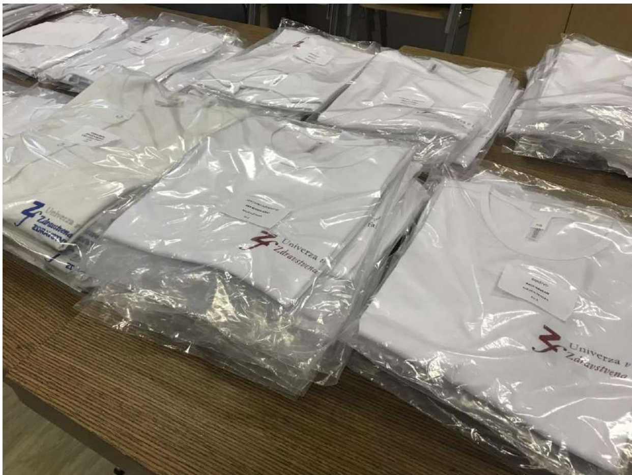
Slika 6: Uniforme študenov ob začetku študija - deljenje

Vsak študent si naroči svojo uniformo, na kateri je navezen znak Zdravstvene fakultete in študijskega programa. Bruci so imeli prvi teden v oktobru možnost pomeriti in naročiti željeno velikost uniform, v mesecu decembru, pa so lahko naročene uniforme prevzeli v prostorih Zdravstvene fakultete. Kot vsako študijsko leto, smo tudi letos študentje tutorji poskrbeli, da je pomerjanje, naročanje in razdeljevanje uniform potekalo nemoteno in hitro.