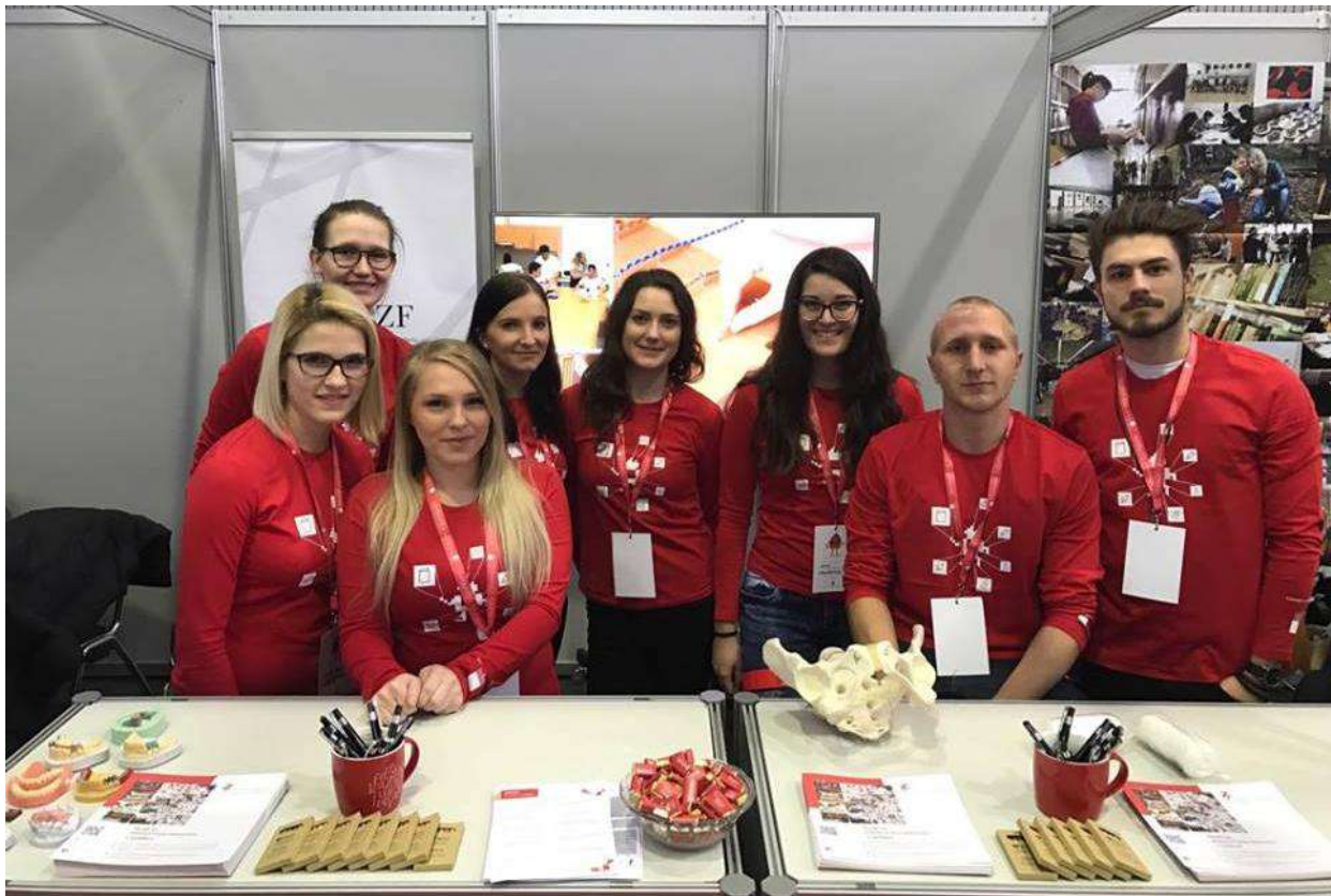
Slika 12: Tutorji študentje na sejmju izobraževanja in poklicev, Informativa 2017