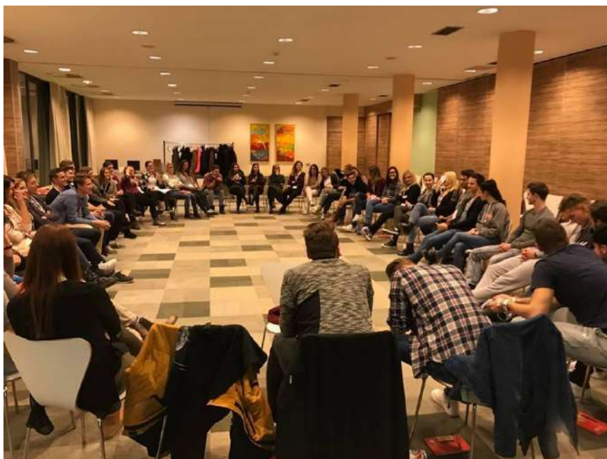
Slika 7: Študentje tutorji na delavnici TEAMBUILDING; Motivacijski vikend 2016

Zadnji dan smo po zajtrku izdelovali voščilnice za zaposlene Zdravstvene fakultete. Sledil je zaključni sestanek in evalvacija Motivacijskega vikenda, nato pa smo se počasi odpravili proti domu. Vikend je potekal v delovnem in sprostitvenem duhu, kar je bil tudi najpomembnejši namen Motivacijskega vikenda za vzdrževanje motivacije uspešnega delovanja organizacij še naprej.