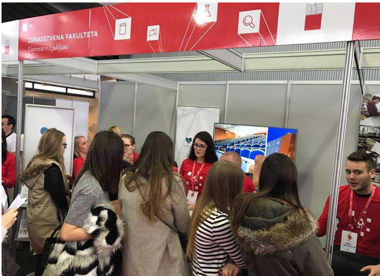
Slika 13: Obiskovalci sejma Informativa 2017 na stojnici Zdravstvene fakultete