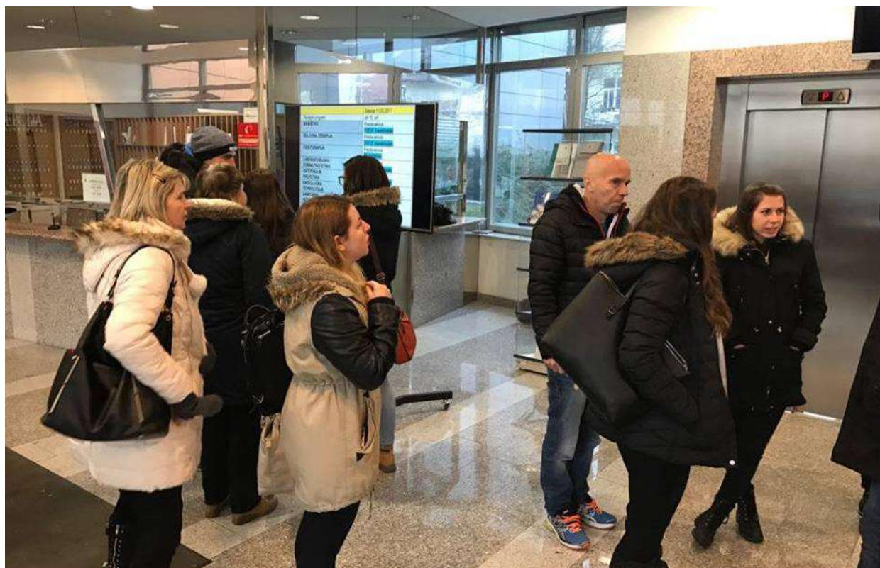
Slika 11: Obiskovalci informativnega dneva na Zdravstveni fakulteti; 11. 2. 2017