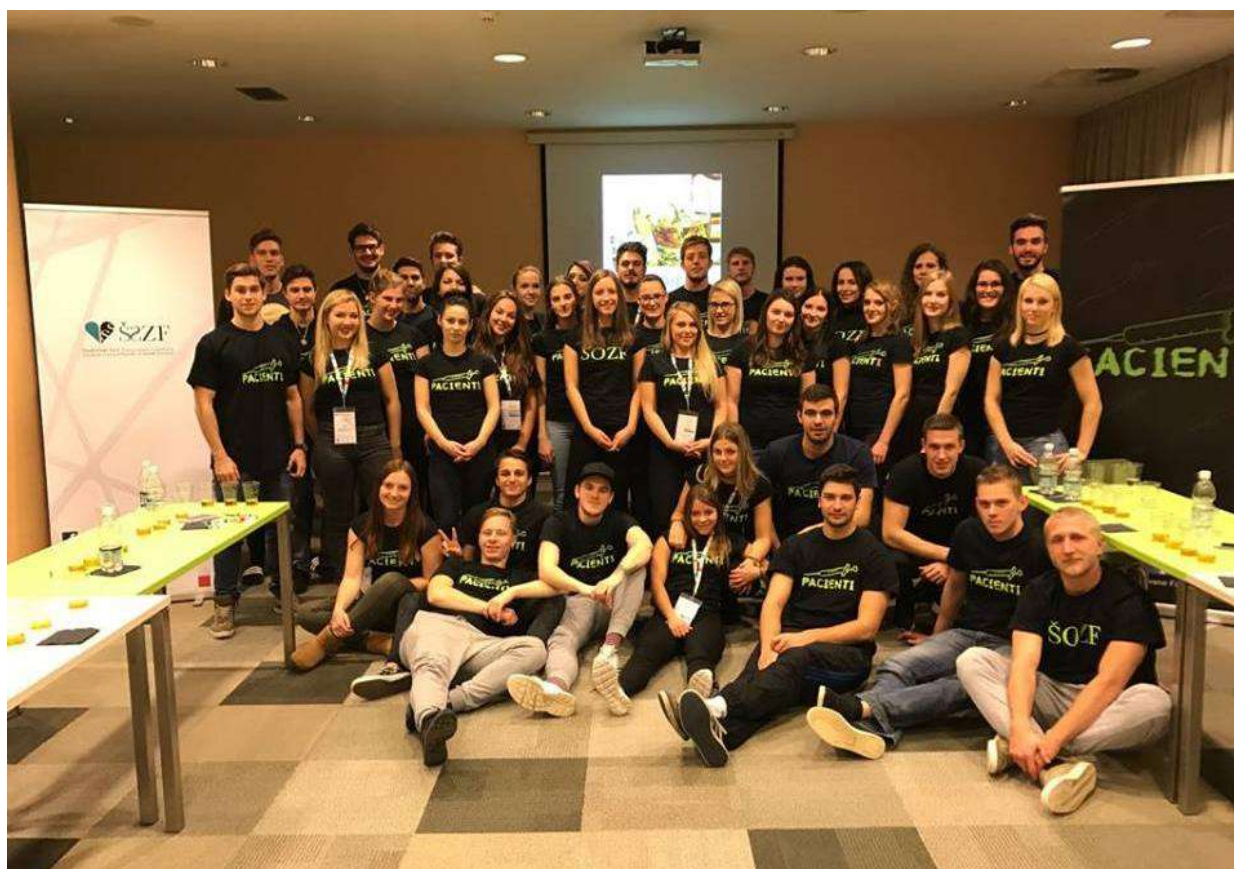
Slika 9: Skupinska slika s tutorji in Pacienti; Motivacijski vikend 2016