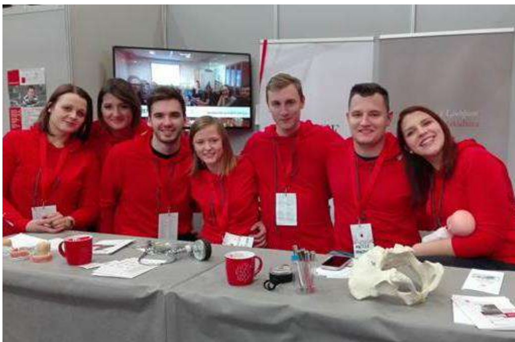
Slika 12: Ekipo tutorjev na petkovi Informativi 2016

Nov dan, nove želje in seveda novi osnovnošolci in dijaki željni informacij o srednjih šolah in fakultetah, ki jim bodo v prihodnjih letih prinesla novo znanje, izkušnje, prijatelje in še mnogo več. Tudi v soboto 23. 1. 2016 smo bili študentje Zdravstvene fakultete na voljo vsem obiskovalcem Informativne, da so nas povprašali o študiju pri nas. Najpogostejša vprašanja so se nanašala predvsem na pogoje vpisa na