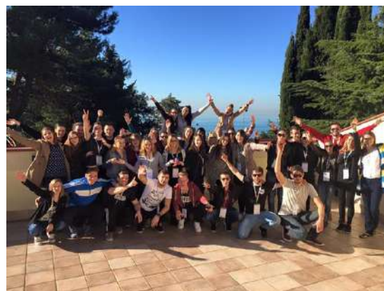
Slika 9: Tutorji, člani študentskega sveta in študentske organizacije ZF

temu, temveč tudi povezovanju in spoznavanju vseh nas. Veliko smo se presmejali in pogovarjali o različnih temah. Sledilo je razvajanje v bazenu ali pa sprehod do morja, da smo si spočili roke za popoldansko delavnico. Ravno tako smo še izdelovali voščilnice ter na koncu še izdelali plan dela za tekoče študijsko leto. Vsakemu se po delu prileže sprostitev, tako je večer potekal v zabavnem in povezovalnem vzdušju vseh treh organizaciji. V nedeljo smo imeli zaključni sestanek kjer smo pokomentirali potek delovno-zabavnega vikenda. Po kosilu smo se odpravili domov