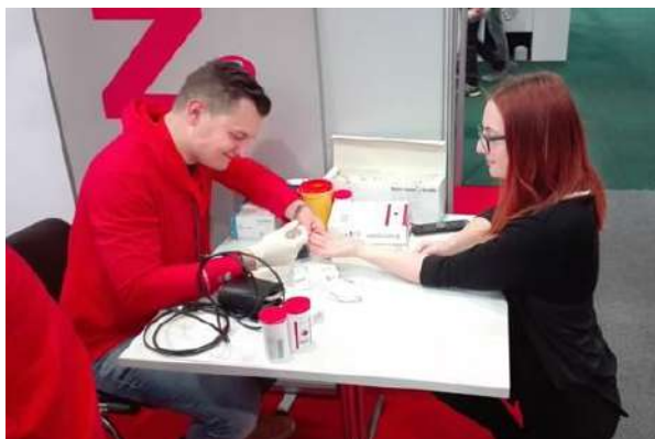
Slika 13: Odvzem kapilarne krvi za krvni sladkor.

posamezne študijske programe, koliko časa študij traja, kako izgleda sam študij na Zdravstveni fakulteti, kakšni so izpiti, če imamo kaj praktičnih obveznosti – prakse in koliko prostega časa nam ob študiju ostane. Za vse, ki so si želeli še več tehničnih podatkov o predmetniku in kreditnih točkah, so s seboj domov lahko odnesli brošuro Zdravstvene fakultete in tudi zloženke posameznih študijskih smeri, ki smo jih zanje pripravili tutorji. Na stojnici smo za obiskovalce pripravili tudi didaktične pripomočke za še zanimivejše predstavitve študijskih programov na Zdravstveni fakulteti, od zobnih protez, pripomočkov za pomoč pri vsakodnevnih opravilih, medenice, pelvimetra, merilca moči, do merjenja krvnega sladkorja v krvi in demonstracije pravilnega razkuževanja rok.