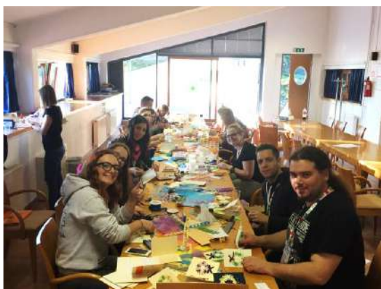
Slika 8: Tutorji med izdelavo voščilnic

V petek 6.11. 2015 smo se študentje tutorji odpravili proti Debelemu Rtiču kjer smo preživeli motivacijski vikend. Ko smo bili vsi skupaj na cilju je bil sestanek, kjer so koordinatorka študentskega tutorstva, predsednik študentskega sveta ZF in študentske organizacije, ZF predstavili plan za prihodnji vikend ter cilje delovanja. Sledila je večerna zabava, kjer smo se bolj spoznali med seboj.