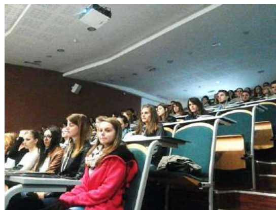
Slika 5: Polna dvorana študentov 1. letnika