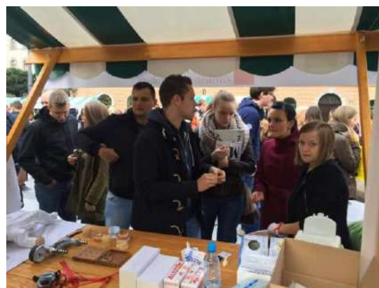
Slika 7: Obiskovalci stojnice

lažje vključevanje ljudi v vsakodnevne aktivnosti, kot naprimer pripomoček za zapenjanje gumbov, prilagojen jedilni pribor in drugo. Poleg tega so predstavili namen invalidskega vozička in rolatorja za gibalno ovirane osebe. Študentje laboratorijske zobne protetike so pokazali izgled totalne zgornje in spodnje proteze, zobne prevleke in druge modelacije v vosku. Bodoči sanitarni inženirji so prikazali, kako v hladilnik pravilno shranjujemo živila, primere mikrobioloških gojišč, hitri mikrobiološki test in izvajali brise za pregled snažnosti površin. Študentje zdravstvene nege so izvajali meritve glukoze v krvi in krvnega tlaka. Z obiskovalci so se pogovarjali o zdravi prehrani in vplivu na krvni tlak. Bodoče babice smo predstavile pravilno rokovanje z novorojenčkom in demonstrirale, kako se razreši zapora dihalne poti s tujkom pri dojenčku. Študentje tutorji smo ob tem predajali informacije o študiju in drugih dejavnostih, ki potekajo na fakulteti. Dogodek smo z zadovoljstvom zaključili v večernih urah in si zaželeli uspešno novo študijsko leto.