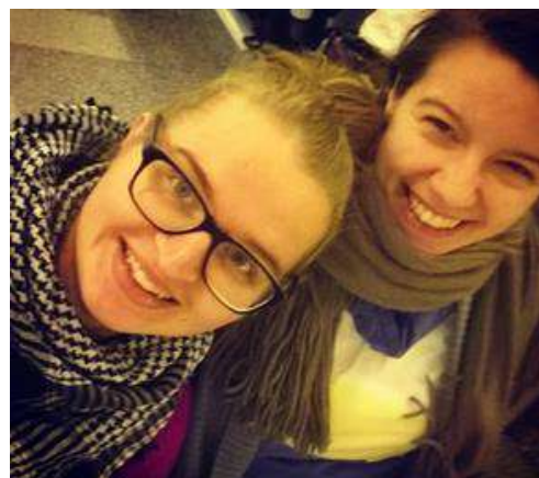
Slika 15: Pred začetkom seminarja.

Na takšnih dogodkih se spoznaš s tutorji drugih študijskih programov in če si prisoten na seminarju, veliko novega izveš. Vsem bodočim tutorjem priporočam naj se udeležijo več takšnih dogodkov, ker si s tem ne širiš le obzorja znanja ampak pridobiš veliko novih poznanstev.