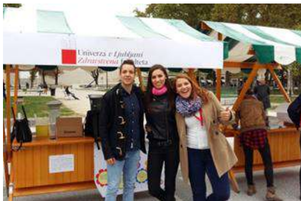
Slika 6: Priprava stojnice