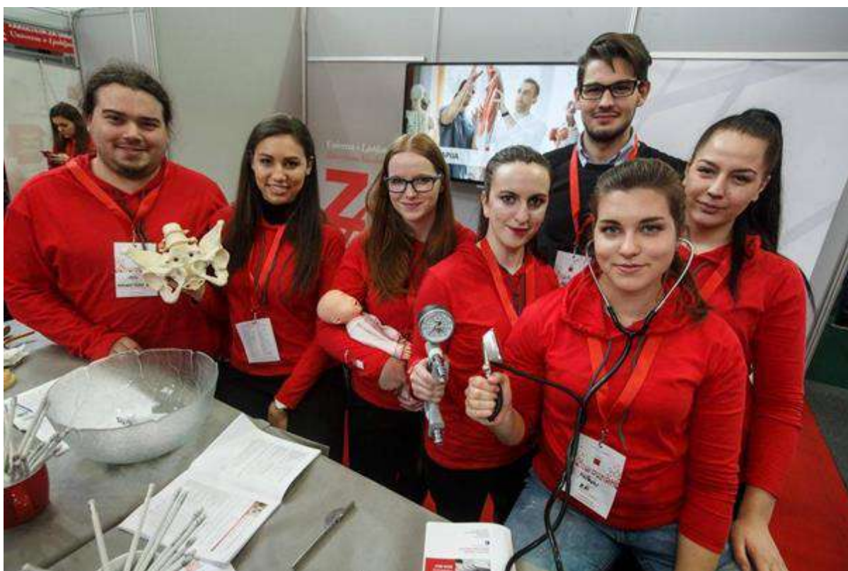
Slika 11: Ekipa turtorjev na petkovi Informativi 2016.

Že v petek smo jih tam, v okviru Univerze v Ljubljani, pričakali tudi študenti Zdravstvene fakultete. Tutorji smo za obiskovalce pripravili zloženke o posameznih študijskih programih in s seboj prinesli nekaj pripomočkov s katerimi