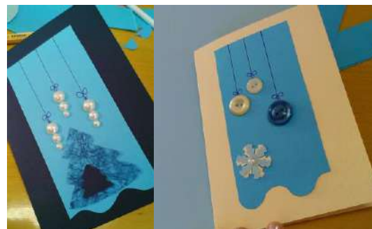
Slika 10: Končni izdelki