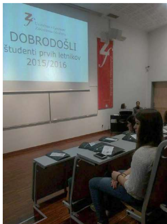
Slika 4: Sprejem brucev na ZF