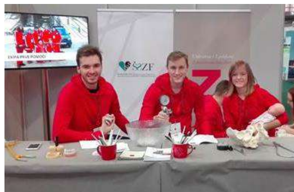
Slika 14: Tutorji s pripomočki iz posameznih študijskih smeri

Polni veselja ob spoznanju, da za nami na Zdravstveno fakulteto prihajajo novi vedoželjni dijaki, smo v poznih popoldanskih urah zapustili prizorišče Informativne 2016.