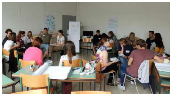
Slika 2: Tutorska delavnica.

Še pred uradnim začetkom študijskega leta, smo se 3.9.2015 zbrali vsi bodoči tutorji na fakulteti, na tutorski delavnici. Glavni namen delavnice je bil, poleg osvojitve pojma študentskega tutorstva, medsebojne pomoči, se spoznati med sabo ter določiti letošnjo vizijo tutorstva. Debatirali smo o naši motivaciji, zakaj smo se sploh odločili postati tutor ter katere odgovornosti nam ta vloga prinese.