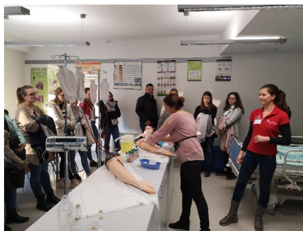
Slika 9 Prikaz aktivnosti na vajah