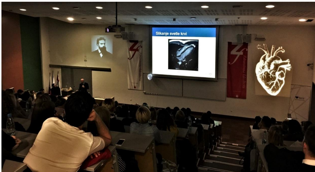
Slika 6 Radiološki kongres

Pripravil: Gregor Jerebic (smer radiološka tehnologija)