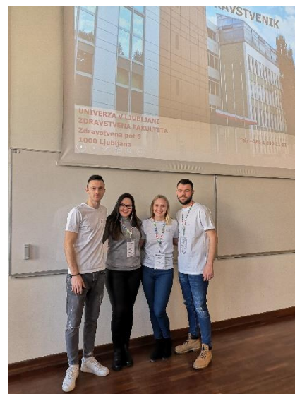
Slika 8 Študentje zdravstvene nege na informativnih dneh

Tako kot vsako leto, sta tudi v letošnjem študijskem letu na Zdravstveni fakulteti potekala informativna dneva, kjer so lahko bodoči študenti pridobili uporabne informacije v zvezi s študijem na naši fakulteti. Informativna dneva sta potekala v petek, 15. februarja, ob 10. in ob 15. uri in v soboto, 16. februarja, ob 10 uri. Tutorji vseh študijskih programov smo bodoče študente usmerjali po celotni Zdravstveni fakulteti, kjer se je vsaka študijska smer podrobneje predstavila. Bodoči študenti so prejeli predstavitvene zloženke za posamezno smer ter natančen predmetnik. Predstavljeni so bili pogoji za vpis, predmetnik, pogoji za napredovanje v višji letnik, potek študija, mednarodne izmenjave ter možnosti za nadaljevanje študija. Tutorji so bodočim študentom podali še druge koristne informacije o študiju, o možnostih prevoza do fakultete, lokacijah študentske prehrane ter lokacijah, kjer bojo potekale klinične vaje. Nato so si bodoči študentje, skupaj s tutorji in mentorji, lahko ogledali opremljene kabinete, kjer potekajo kabinetne vaje. Lahko so si ogledali celo simulacijo oživljanja v enem izmed kabinetov zdravstvene nege. Tisti, ki so želeli, so lahko tudi sodelovali. Tutorji so bili odprti za vsa vprašanja.