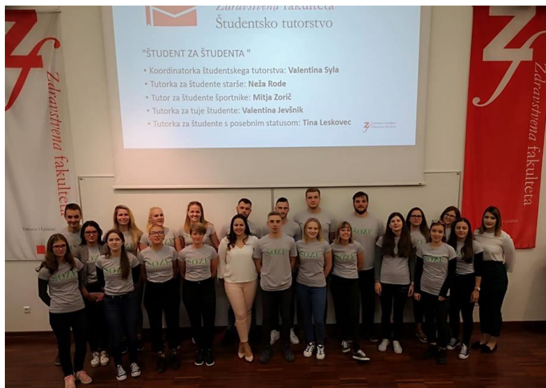
Slika 4 Sprejem brucev

Pripravila: Patricija Sevšek (smer zdravstvena nega)