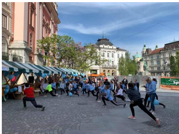
Slika 12 Babiški tek