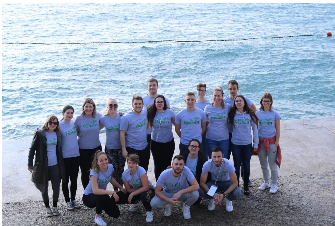
Slika 7 Zdravstveni vikend

Pripravila: Samanta Rituper (smer fizioterapija)