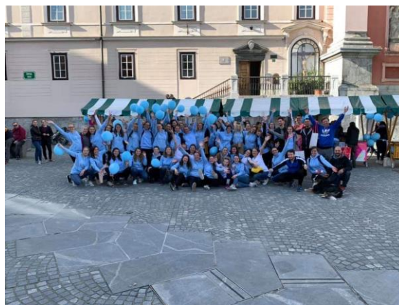
Slika 11 Babiški teden