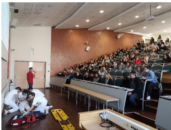
Slika 10 Prikaz nudenja nujne medicinske pomoči

Pripravil: Ismet Halilović (smer zdravstvena nega)