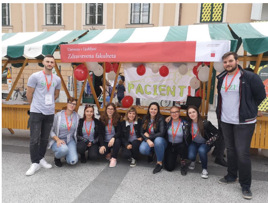
Slika 5 Pozdrav brucem na Kongresnem trgu

Pripravil: Ismet Halilović (smer zdravstvena nega)