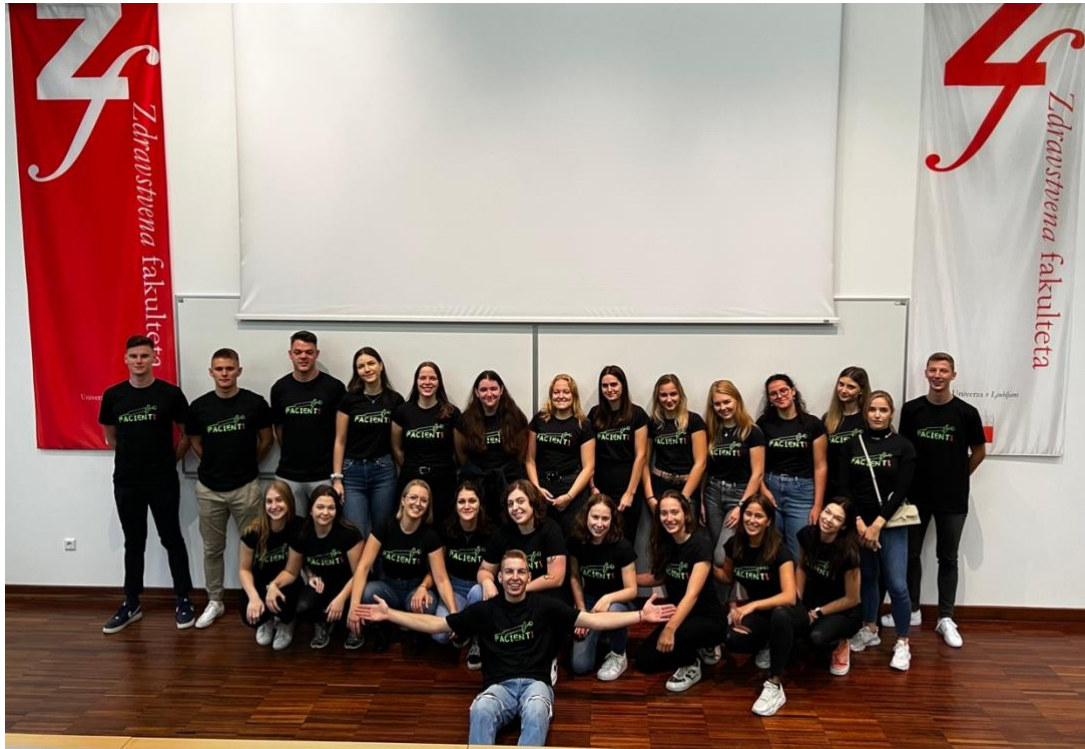
Slika 5: Tutorji študijskega leta 2022/23 ob sprejemu brucev, 30. 09. 2022

Po končanih uvodnih predstavitvah smo bili na voljo za njihova dodatna vprašanja, ki so se jim pojavila tekom naše predstavitve. Vprašanja so se nanašala predvsem na literaturo, ki je potrebna za izpite, študentsko delo in prehrano. Vse bruce smo povabili na spoznavni žur Zdravstvene fakultete in zdravstveni vikend.