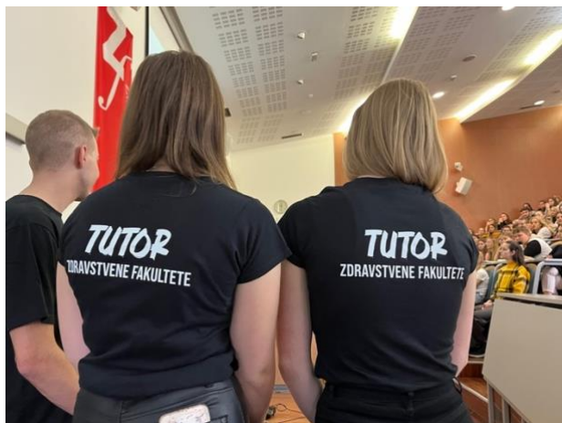
Slika 2: Tutorske majice