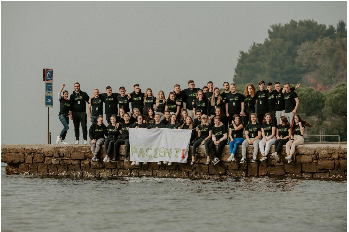
Slika 1: Skupinska slika vseh udeležencev motivacijskega vikenda