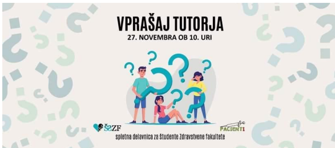
Slika 2: Dogodek vprašaj tutorja